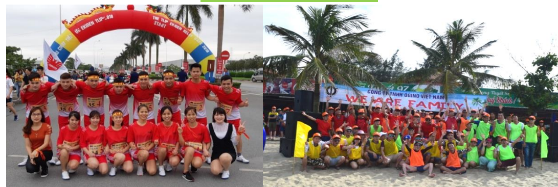
Hoạt động văn hóa thể thao